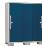
DO(ディープオーシャンブルー)-3