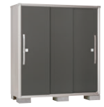
GM(グライファイトメタリック)-2