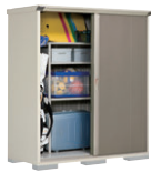
CB(カーボンブラウン)-2 NEW