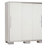
TW(ティントホワイト)-1