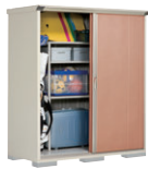
TR(トロピカルオレンジ)-3 NEW