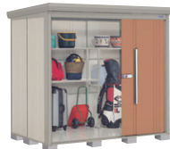
T(トロピカルオレンジ)-3 NEW