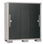
WE(ウェッジエボニー)-4