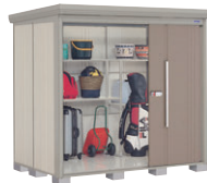
B(カーボンブラウン)-1 NEW